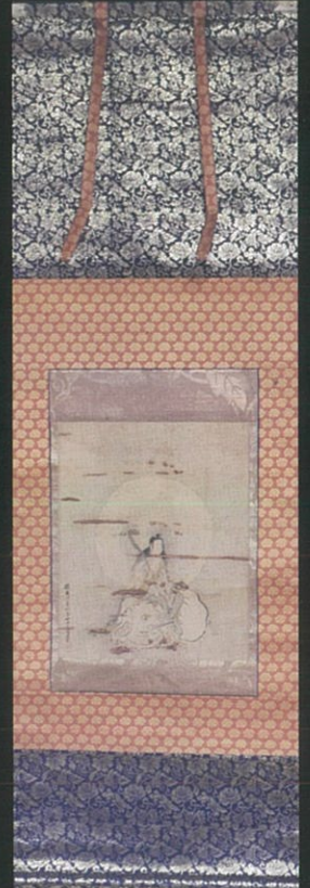
(伝) 普賢菩薩 狩野探幽