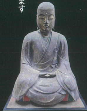
僧形 文殊菩薩 永正15年(1518年)3月 院派仏師作

狩野探幽の画や 楠木正成の遺状など 普段は見ることのできない 貴重な文化財を公開いたします