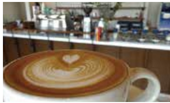
Taibow!coffee & gelato soft

夏から秋に「わらアートまつり」を開催。春の桜、夏のひまわり、秋のコスモス、年中楽しめる癒しのスポット