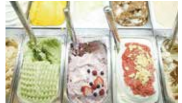
ジェラテリア・レガーロ

創業 130年余年。銘酒揃いなのはもちろん、酒蔵見学とそのアテンドを務める看板女将も魅力!見学と試飲は無料