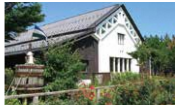
カーブドッチワイナリー

スペシャルティコーヒーとジェラート、ソフトクリームが自慢。角田山を眺めながらのおしゃれなカフェタイムを