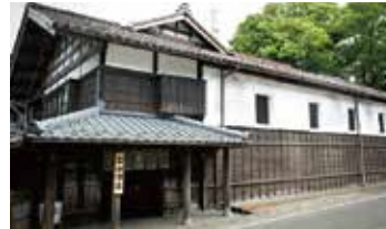
宝山酒造 (※見学は要予約)

日帰り温泉では他に類を見ない3本の源泉を抱える。食堂「多宝亭」は、直営農場のこだわり食材を使用